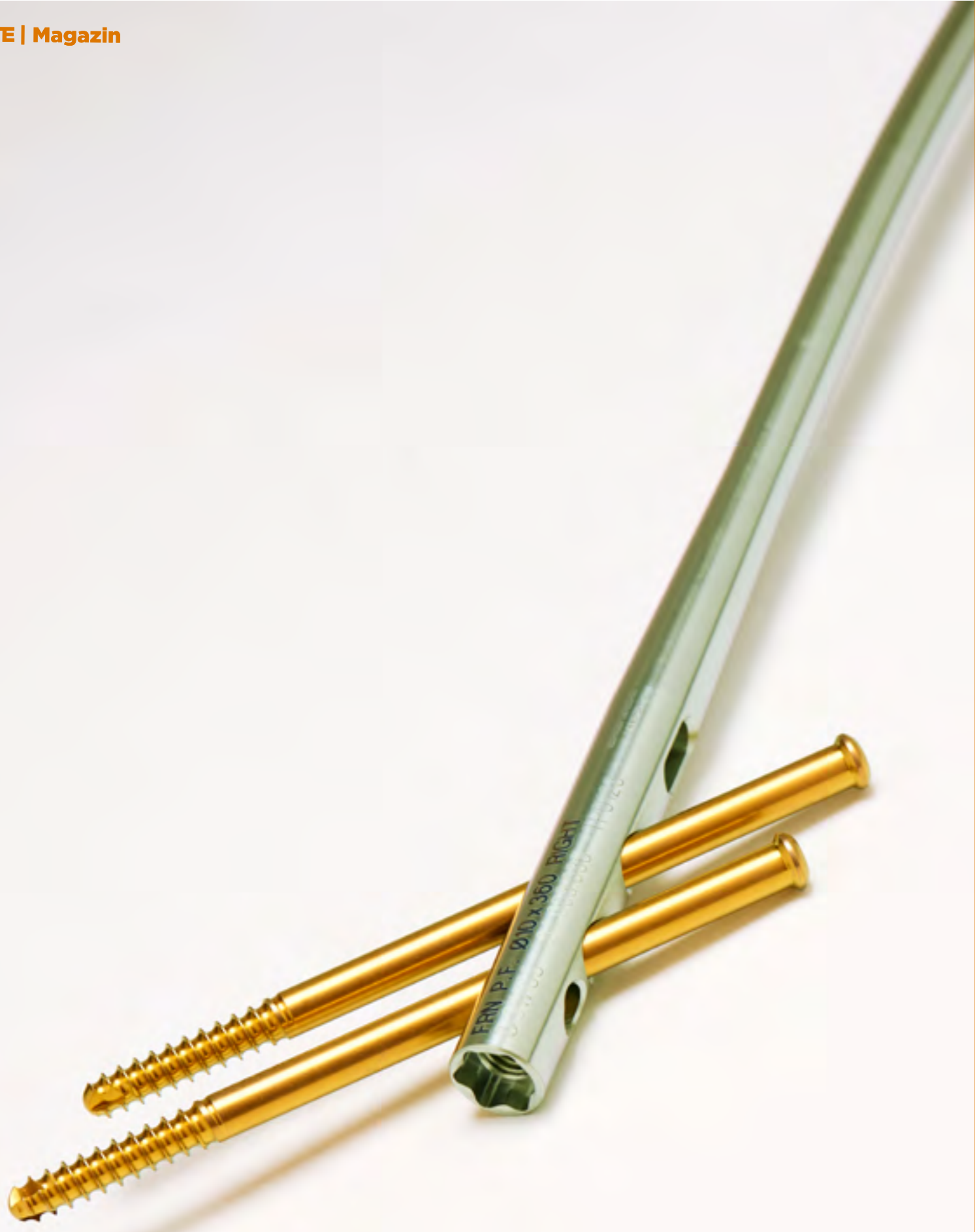
DePuy Synthes by Johnson&Johnson Nagel und Schrauben «Glamour Shot»