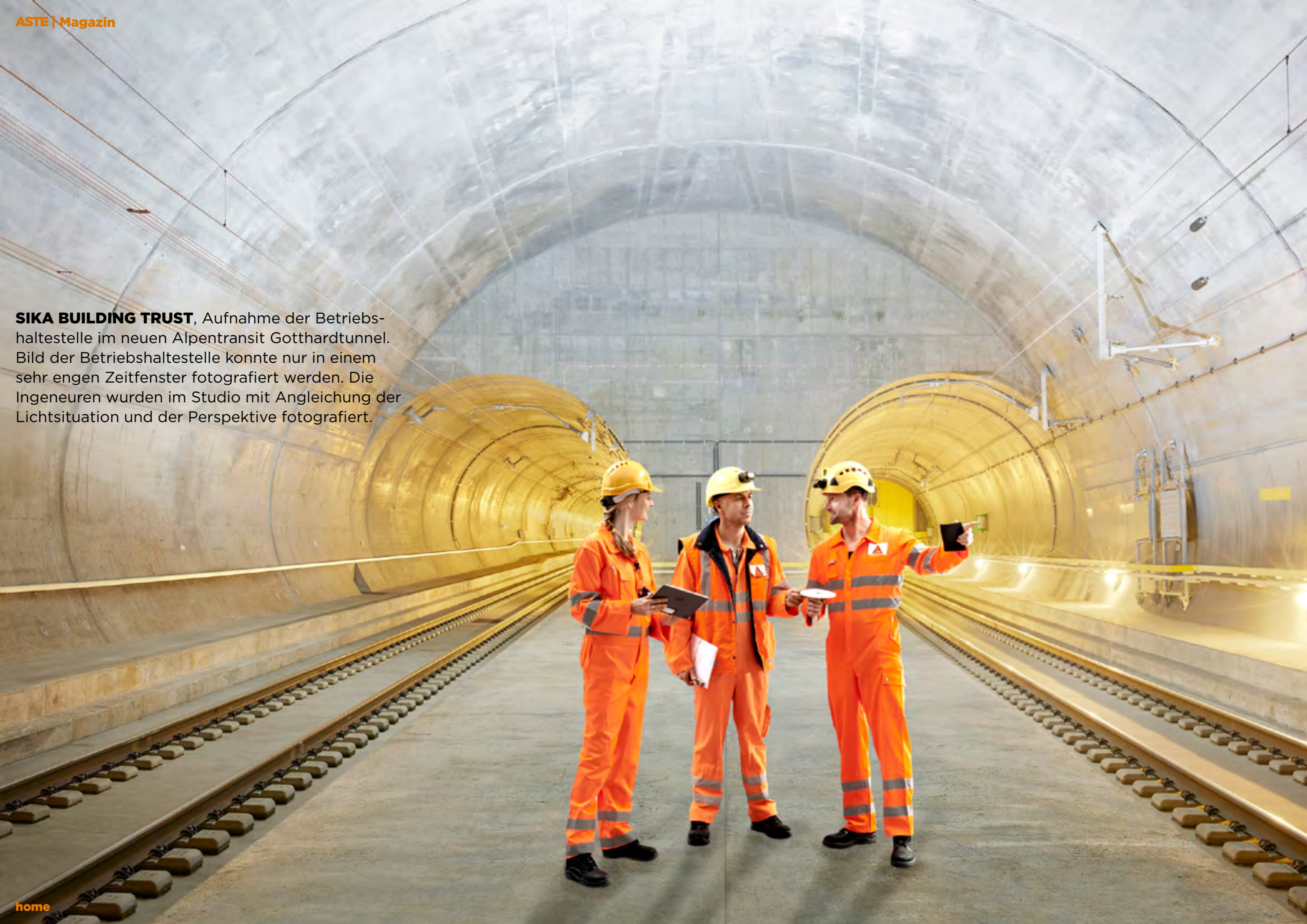
SIKA BUILDING TRUST , Aufnahme der Betriebs- haltestelle im neuen Alpentransit Gotthardtunnel. Bild der Betriebshaltestelle konnte nur in einem sehr engen Zeitfenster fotografiert werden. Die Ingenieure wurden im Studio mit Angleichung der Lichtsituation und der Perspektive fotografiert.